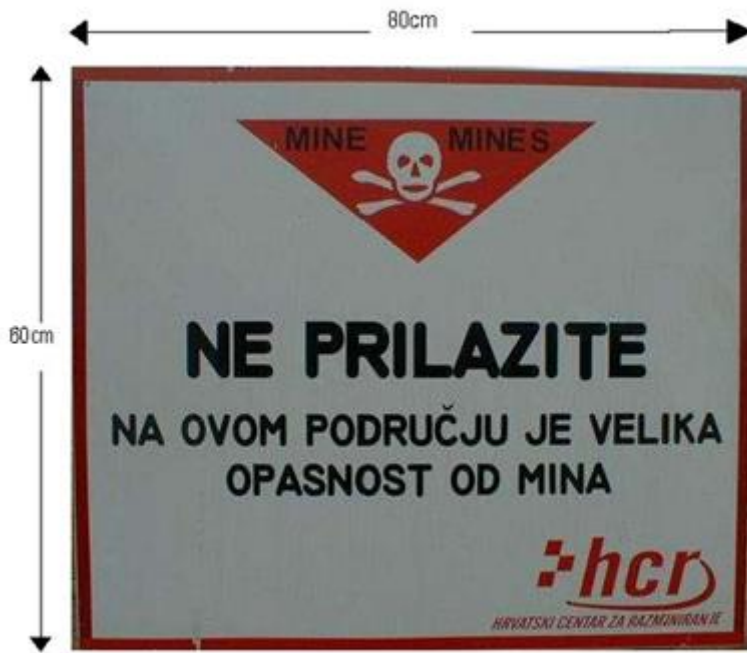
Slika 4: Tabla opasnosti od NUS-a