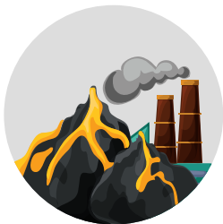
PRIRODNE NEPOGODE JAČEG INTENZITETA